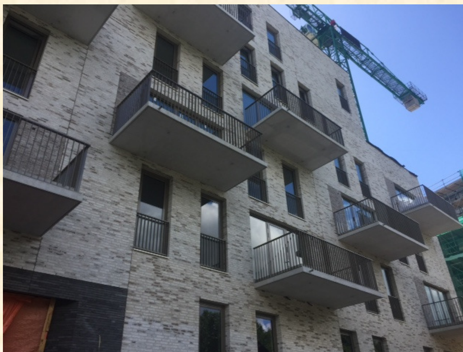
Gebouw Alba van het complex Zuiderheide, dat in 2018 opgeleverd is.