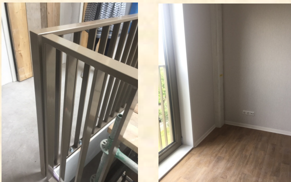
Enkele voorbeelden uit de inspectie