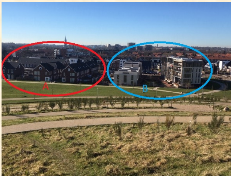
Het uitbreidingsplan Anna's Hoeve vanaf de Anna's Berg met links een blok sociale huurwoningen van Het Gooi eo (A) en rechts een project van de CPO Almansweide (B).