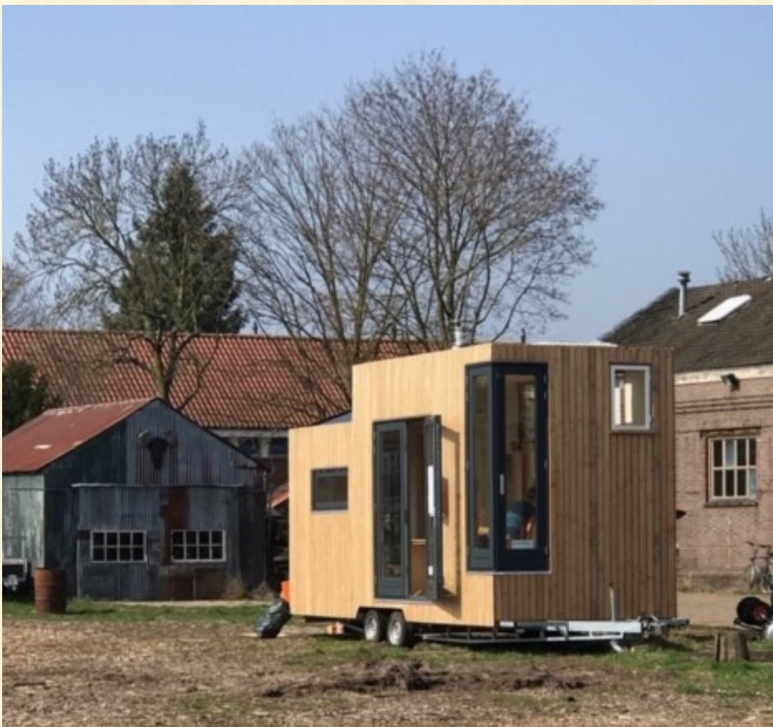
Het Tiny House zoals het een tijdje op Werf 35 heeft gestaan

Het toilet bestaat uit twee delen. De toiletspot bestaat uit een voor- en achtergedeelte zodat de grote en kleine boodschap worden gescheiden en apart verwerkt. Er is een kleine keukenunit met een tafelblad. Het tafelblad kan aan het bedgedeelte worden geplaatst zodat er een tweepersoonsbed ontstaat. Via een trappetje kom je op een bovengedeelte waar een eenpersoonsbed staat.