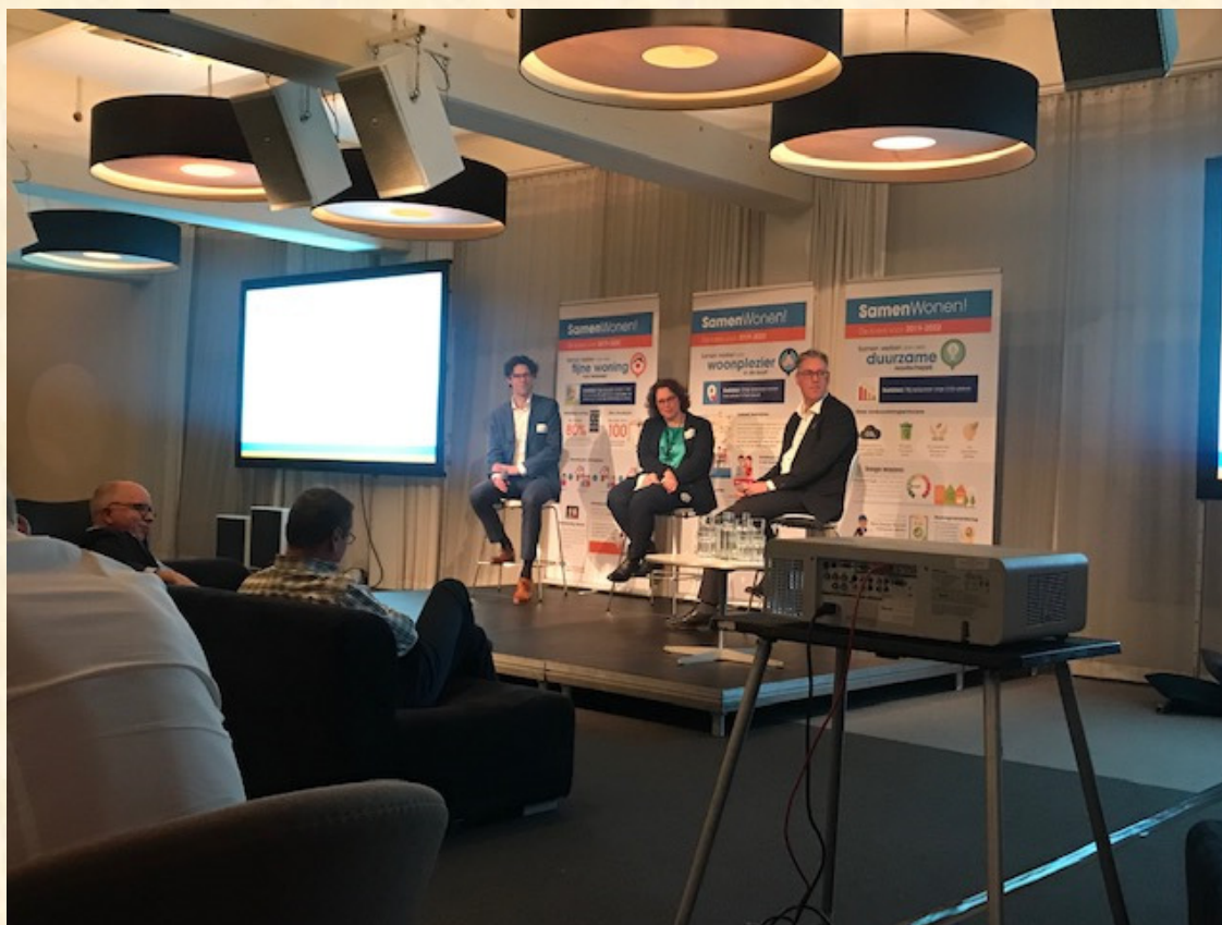
Bijeenkomst van Gooi en Omstreken over 'Samenwonen' in het Spant te Bussum op 11 februari 2019

Een passende woning voor iedereen betekent voor Het Gooi en Omstreken vooral anticiperen op de veranderingen die de bewoners van de door deze corporatie beheerde woningen kunnen verwachten. Voorbeeld: het streven om ouderen langer thuis te laten wonen. Het Gooi en Omstreken heeft voor de doelgroep 65+ een wooncoach aangesteld. Het is de bedoeling dat deze bij elke huurder boven de 65 jaar op huisbezoek gaat voor een gesprek over de toekomstige woonbehoeften. Vaak blijken deze mensen niet goed op de hoogte van de mogelijkheden. Via dit gesprek worden de mensen gestimuleerd na te denken over hun wensen als langer thuis wonen