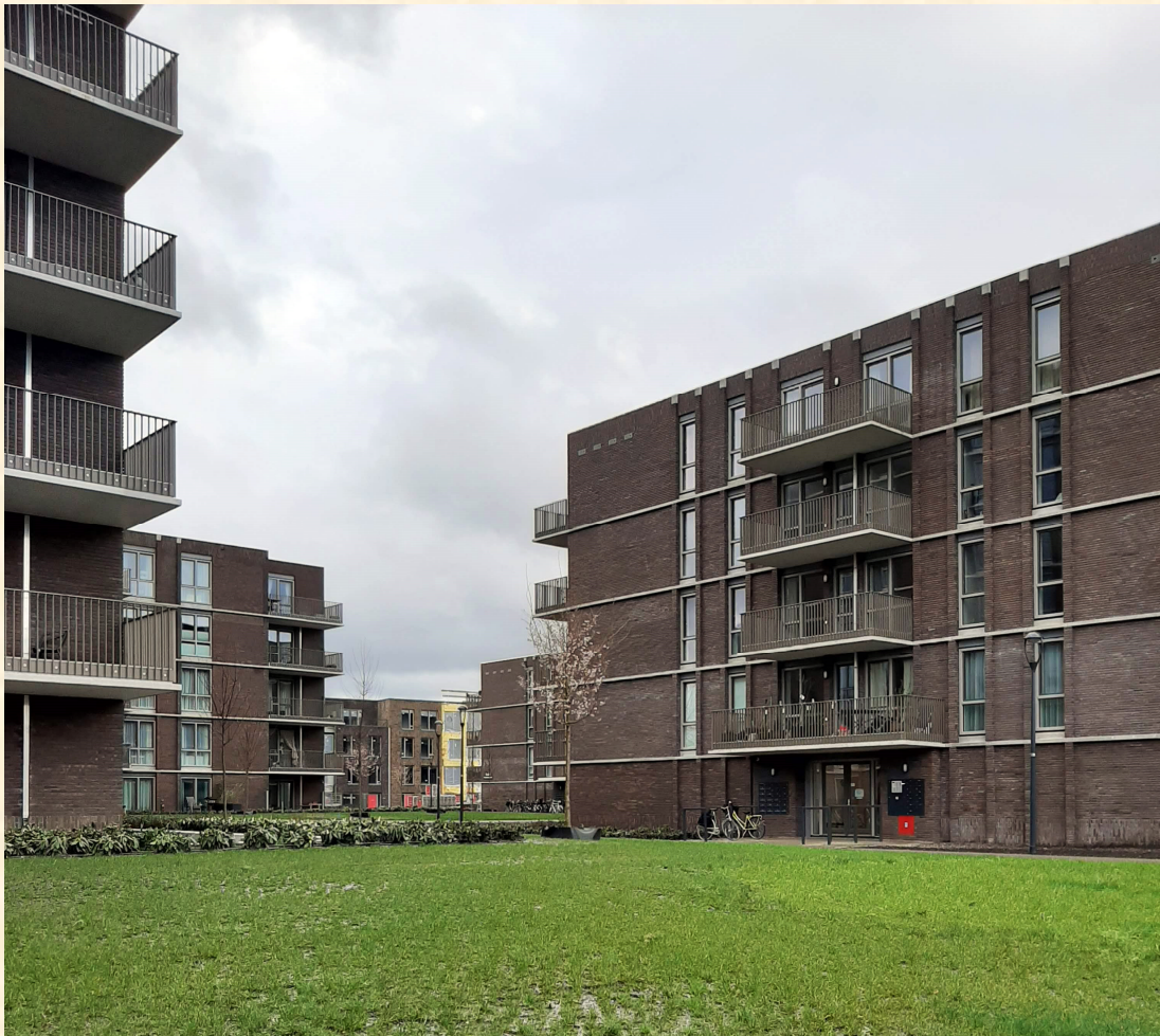
Het project van De Alliantie aan de Larenseweg op het voormalige Lucentterrein