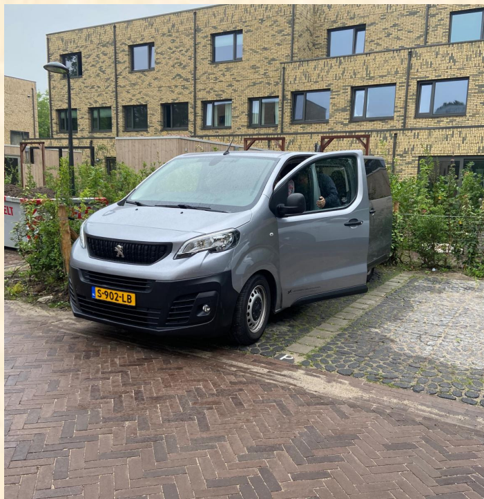
Aangekomen bij Wickefoort in Cruquius

Wij zien ontwikkelingen in de nieuwbouwplannen, waarover wij niet erg enthousiast zijn. Hierover kunt u verder in dit jaarverslag meer lezen.