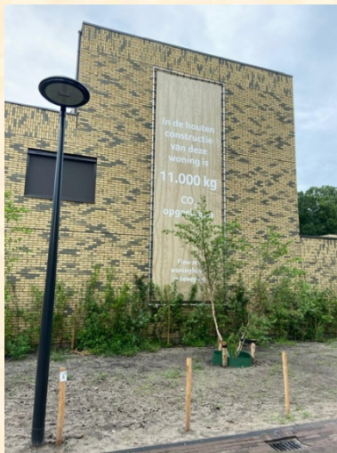
Foto impressie van ons bezoek.

Tijdens ons bezoek hebben wij de modelwoning kunnen bezichtigen en hebben wij een wandeling gemaakt door de wijk. Ons bezoek werd afgerond met een broodjeslunch. Al met al een interessante bijeenkomst, waarin wij kennis hebben genomen van modulaire houtbouw en het eindresultaat hebben bewonderd.